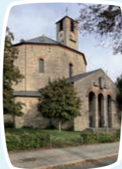
A. Rüttger, kobold layout

Während der Vorlesungszeit gestalten die evangelische und katholische Universitätsseelsorge Gottesdienste, zu denen alle Universitätsangehörige und Interessierte herzlich eingeladen sind. Gestaltet werden diese Gottesdienste von Studierenden, Universitätsangehörigen und anderen. // → So abends, 19 h // Wenn nicht anders angegeben in der Erlöserkirche, Kunigundendamm 14